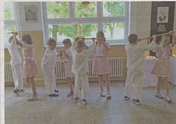
A 2. és 3. osztályosok műsorral készültek a megemlékezésre