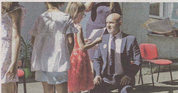
Tegnap három iskolában is a miniszter adta át a „pandémiás” bizonyítványt. Gröhlting ígéretet tett, hogy soha többé nem lesz országos iskolabezárás, legfeljebb regionális. Hozzá kell azonban tennünk, hogy a tavalyi tanév végén is pontosan ezt ígérte, ám most az oltás miatt jobb lehet a helyzet.

Voltak olyan felső tagozatos és középiskolás évfolyamok, melyek csak tavaly szeptemberben-októberben, és most májustól, szűk két-két hónapot jártak iskolába. A Szlovák Pedagóguskamara felmérése szerint a tanárok többsége úgy véli, a tanulók legalább két hónappal vannak elmaradva a tananyaggal, több kimutatás szerint pedig minimum 10 százaléuk egyáltalán nem tudott részt venni a távoktatásban. A felzárkóztatás érdekében az intézmények augusztusban nyári iskolát szervezhetnek minisztériumi támogatással. (Uzs)