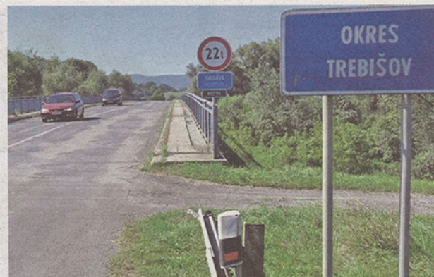
A hidat június 21-én, szinte egyik napról a másikra zárták le a forgalom elől

Egy hete tehát a hidat azért zárták le, mert balesetveszélyessé vált, akkor úgy vélték, hogy legkorábban a felújítást követően, valamikor jövő év elején nyithatják meg a forgalom elől. Trnka közölte, hogy a folyó szélessége miatt ideiglenes áthidalásra sincs lehetőség. A napokban viszont kiderült, egy speciális megoldásnak köszönhetően mégiscsak megkönnyíthetik az itt élők minden napjait. „Mivel a híd a Nagykapos és Királyhelme közötti fő útvonal részét képezi, muszáj volt megoldást találni a problémára. Bár számunkra az emberek biztonsága a legfontosabb, tisztában vagyunk azzal, hogy a híd teljes lezárása óriási gondot jelent az itt élőknek és az erre közlekedőknek. A megye egyik leghosszabb hidjáról van szó, mert az Ondava folyó szélessége a 200 métert is meghaladja. Ezért sem lehet a folyót teljes szélességében ideiglenesen áthidalni, de a statikus véleménye szerint a híd lebontásra kerülő részén ez megoldható. Ez azt jelenti, hogy bár korlátozottan, de legalább a felújítás során is járható lesz a híd” – közölte Rastislav Trnka megyeelnök. A jó hír tehát az, hogy van megoldás, a rossz viszont az, hogy a híd korlátozott újranyitására csak a bontási munkák elvégzése után kerül sor. Ha minden jól halad, az első autók valamikor szeptember ele-