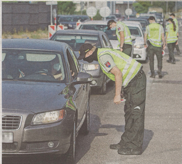
De, mégis lehet minden autó mellé rendőrt állítani. A napokban tartott néhány főpróbát határellenőrzésből a rendőrség. A kormány szerint ez várható egész nyáron, a beoltatlan hazatérőket kiszűrjük és karanténba küldjük.

A központi válságstáb ajánlása alapján tegnap a kormány jóváhagyta az utazási jelzőlámpa második változatát, amely a külföldről való hazatérés feltételeit szabályozza. Az államok színek szerinti besorolása megszűnik július 9-től, piros, zöld és fekete helyett mindegyik fekete lesz. A külföldről hazatérők kizárólag akkor kerülhetnek el a kötelező karanténra, ha már be vannak oltva. Aki nincs, arra 14 napos kötelező házi karantén vár, melyet negatív PCR-tesztel lehet kiváltani, legkorábban a hazatérés utáni 5. napon. Az új sza-