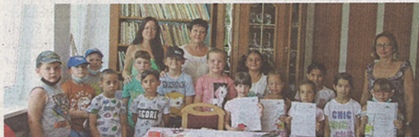
Látogatás a hodosi könyvtárban

A könyvtárat az iskolák minden osztálya meglátogatta. Minden kisdíjakot ünnepélyesen „olvasóvá” avatták, oklevelet is kaptak.